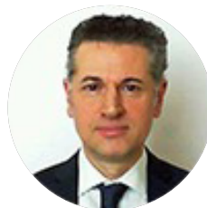
Vincenzo De Luca

Se il Governo, con la prossima Manovra di Bilancio, sarà in grado di dare piena attuazione a questi punti il nostro Paese avrà, davvero, un Fisco più equo, più semplice ed amico della crescita.